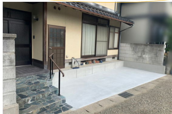
駐車場ができました。