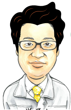
営業部 イナバウアー