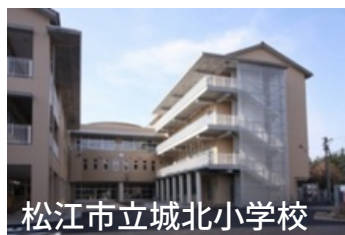
松江市立城北小学校