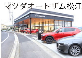
マツダオートザム松江