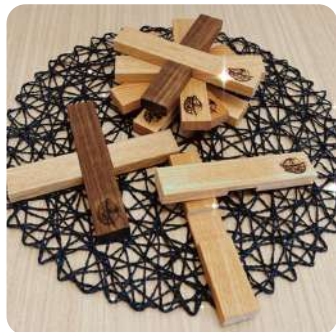
↑鍋敷き コースター↓

我々が家具木工部(世界分の1工房)は製作家具以外も作っています。 今回はいちおしの雑貨をご紹介します!