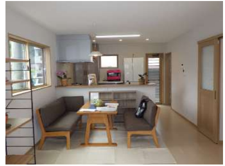
LDKのスペースも広いですね しかも明るい！