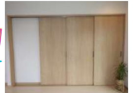
建具が全て壁に収まると 広さを感じますね！