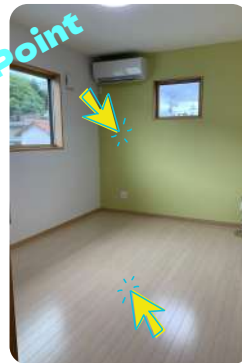
鮮やかな壁紙の色に 明るい色のフローリング