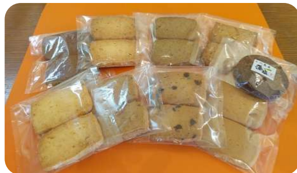
どれも美味しそう！！