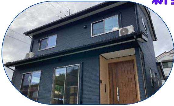
モダンでシックなネイビー色の外観